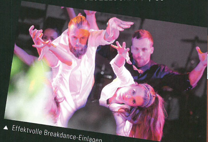
▲ Effektvolle Breakdance-Einlagen.