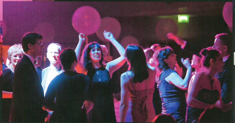
▲ Gute Stimmung auf der Tanzfläche. ▲