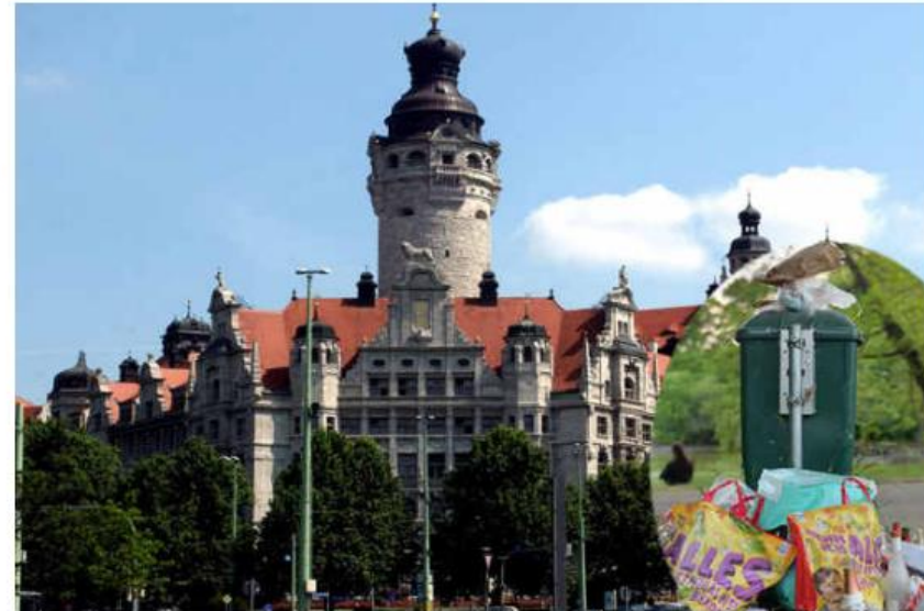
Das Müllproblem in Leipzig ist einer von sieben Punkten auf der Mängelliste des Unternehmerverbandes.

Bis September will der Unternehmerverband seine Forderungen zu Papier bringen. Dann soll die Liste den Fraktionen im Stadtrat vorgelegt werden.