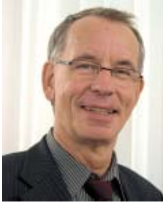
Hartmut Bunsen Präsident des Unternehmerverbandes Sachsen