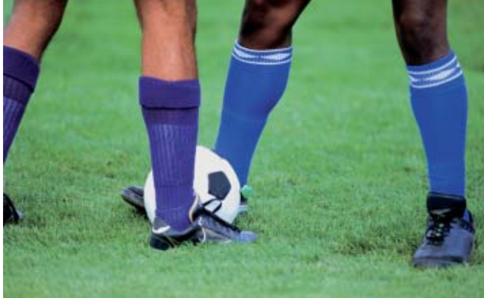
Fußballfans aus aller Welt werden 2006 in Leipzig spannende Spiele erleben.

Positive Signale bei Informationsveranstaltung: Besucherstrom soll für volle Kassen sorgen